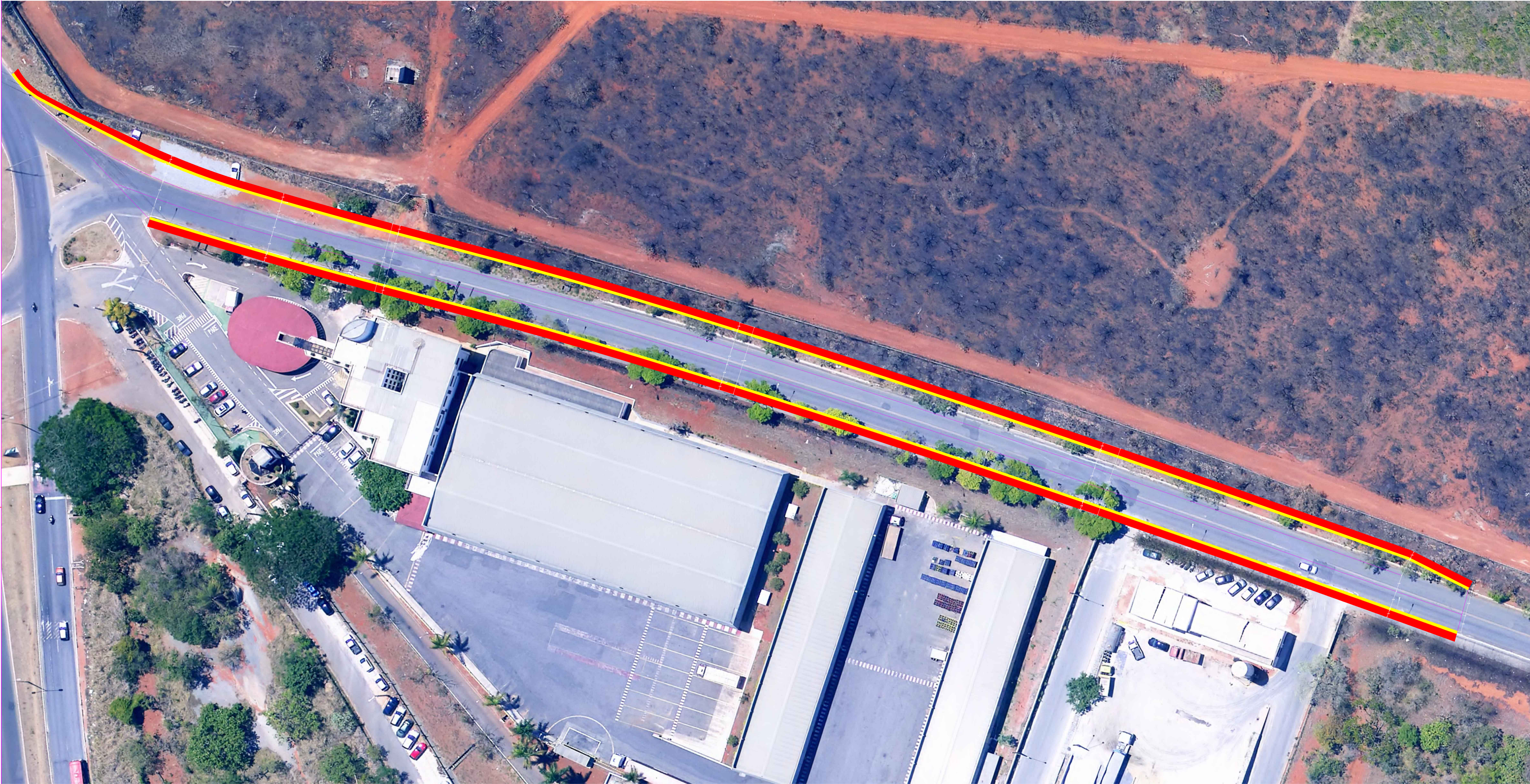
Avenida Integração Escala 1/500